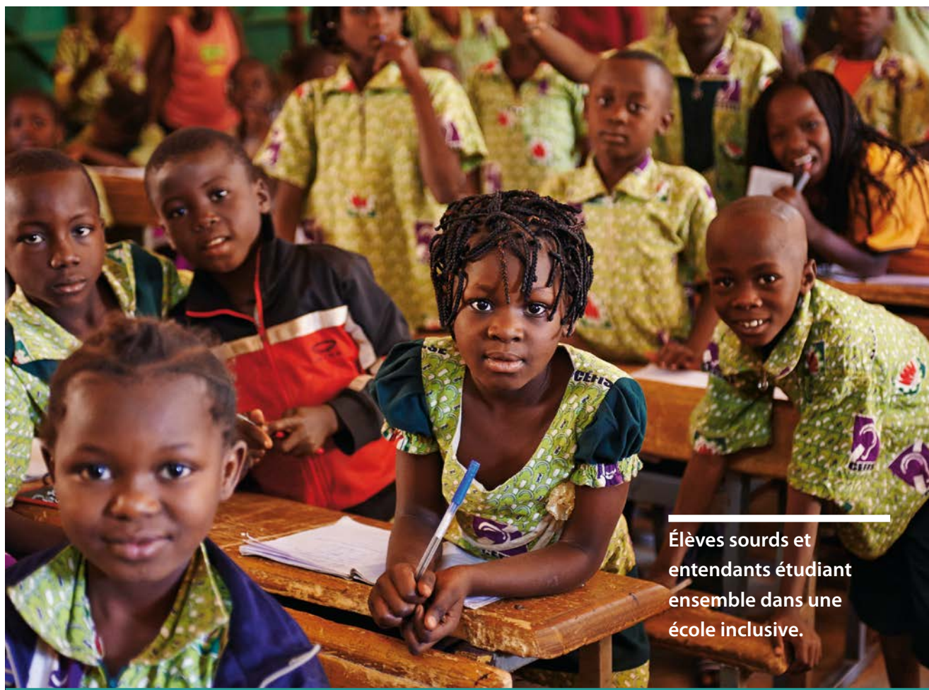
Élèves sourds et entendants étudiant ensemble dans une école inclusive.